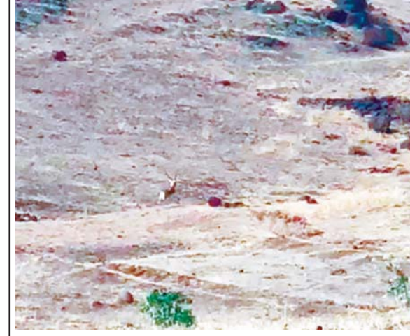
तांबडे मळा येथे अन्न पाण्याच्या शोधात माळरानावर फिरताना काळवीट