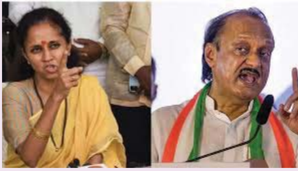
निवडणुकीचा रिंगणात आहेत. यामुळे बारामतीमधील राजकीय वातावरण तापलं आहे. अशातच

बारामती : संपूर्ण महाराष्ट्रांचं लक्ष लागून असलेल्या बारामती लोकसभा मतदारसंघात नगद-भावजय यांच्या लढत होत आहे. राष्ट्रवादी काँग्रेस शरदचंद्र पवार पक्षाचे अध्यक्ष शरद पवार यांची कन्या आणि नेत्या सुप्रिया सुळे या महाविकास आघाडीकडून लढत आहेत. नंतर उपमुख्यमंत्री अजित पवार यांच्या पत्नी सुनेत्रा पवार महायुतीकडून