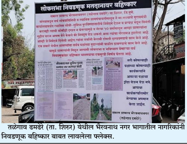
तळेगाव दमढेरे (ता. शिरूर) येथील भैरवनाथ नगर भागातील नागरिकांनी निवडणूक बहिष्कार बाबत लावलेला फ्लेक्स.

निर्णय घेतला असून याबाबतचे फ्लेक्स देखील गावातील मुख्य ठिकाणी लावले आहे. भैरवनाथ नगर मध्ये तीनशेच्या आसपास मतदार असून स्थानिक प्रशासना सह तालुका व जिल्हा प्रशासनाला वारंवार विनंती करून सुद्धा या लोक वस्तीकडे दुर्लक्ष केले जात असल्याने ग्रामस्थांनी हा निर्णय घेतला असून जोपर्यंत आवश्यक सर्व सुखसुविधा उपलब्ध होत नाही तोपर्यंत कोणत्याही निवडणुकीला मतदान करणार नाही व ग्रामपंचायतचा कोणताच कर भरणार नाही असे देखील येथील ग्रामस्थ व नागरिकांनी सांगितले आहे.