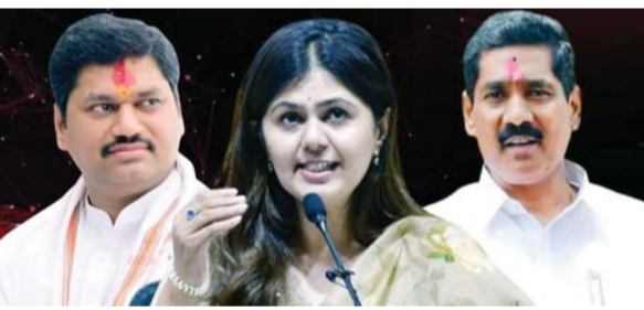
प्रतिनिधी | राष्ट्र सह्याद्री

बीड : तुम्ही बहिण भाऊ एक झालात, अगोदर लोकांचे पैसे द्या असे म्हणत वैद्यनाथ कारखान्यावरून बजरंग सोनवणे यांनी पंकजा मुंडे यांच्यावर खळबळजनक आरोप केले. पुढे ते म्हणाले, तुमच्या खासदाराला तुम्ही तुमच्या