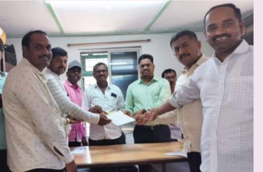
वाजेवाडी (ता. शिरूर) गावाला चासकमानचे पाणी सोडण्याची मागणी करताना ग्रामस्थ.