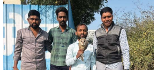
शिक्रापूर (ता. शिरूर) येथे कावळ्यांच्या हल्ल्यातून घुबडाला जीवदान देताना प्राणीमित्र.