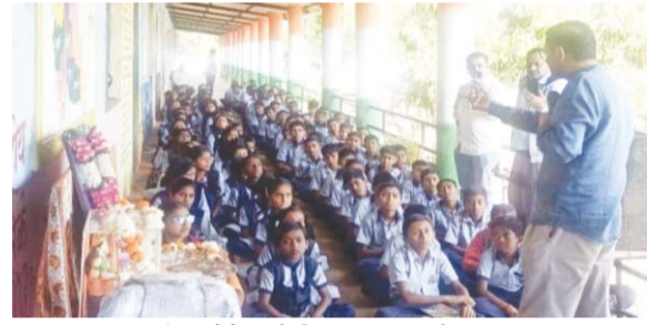
माहूर (ता.पुंरंद) येथे साहित्यिक आपल्या विद्यालयात उपक्रम राबविण्यात आला.