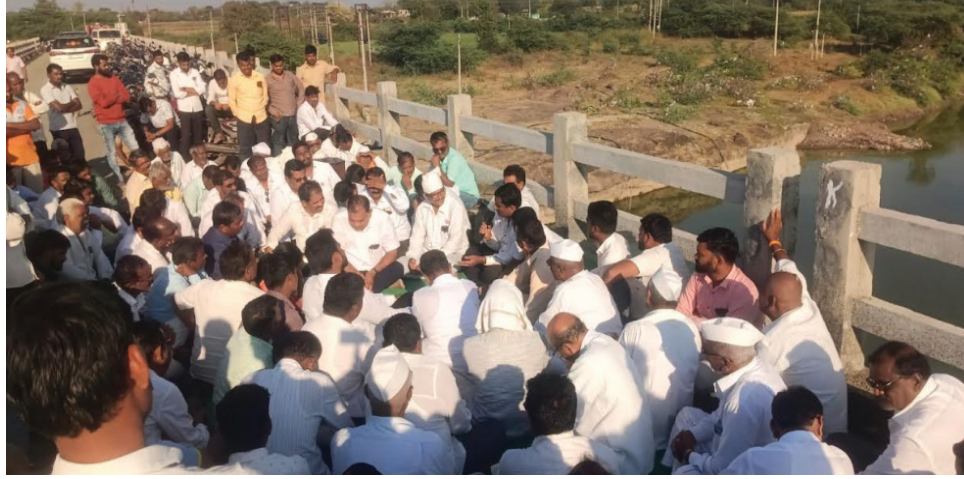
इंशारा दिला होता. लेखी आश्वासन दिल्याशिवाय आंदोलन थांबरनाही असा पवित्रा आंदोलकांनी घेतल्याने