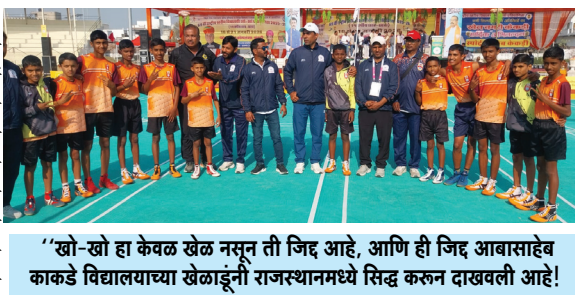
"खो-खो हा केवळ खेळ नसून ती जिद्द आहे, आणि ही जिद्द आबासाहेब काकडे विद्यालयाच्या खेळाडूंनी राजस्थानमध्ये सिद्ध करून दाखवली आहे!"