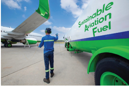
मुंबईतील 'झेडआरडू ग्रुप होल्डिंग्स लि.' या कंपनीमार्फत हा प्रकल्प साकारला जाणार आहे. राज्य मंत्रिमंडळाच्या ३१ डिसेंबर २०२५ रोजीच्या मंत्रिमंडळ बैठकीत विमान वाहतुकीसाठी लागणारे

प्रतिनिधी | राष्ट्र सह्याद्री श्रीरामपूर : श्रीरामपूर तालुक्यातील हेरगाव येथील महाराष्ट्र राज्य शेती म हामंडळाच्या ०४ हजार एकर जमिनीवर जागतिक दर्जाचा शाश्वत विमान इंधन (निगेटिव्ह नेट झिरो इंधन) प्रकल्प उभारला जाणार आहे. या भव्य प्रकल्पाला जमीन हस्तांतरित करण्याची प्रक्रिया राबविण्यासाठी राज्य सरकारने महसूल मंत्री चंद्रशेखर बावनकुळे यांच्या अध्यक्षतेखाली उच्चस्तरीय मंत्रिमंडळ उपसमितीची स्थापना केली आहे.