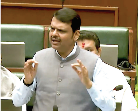
शाळा मराठी माध्यमांच्या आहेत आणि ६९ टक्के विद्यार्थी मराठी शिकत आहेत. मराठी शाळा बंद पडल्याची माहिती कपोलकल्पित आहे.