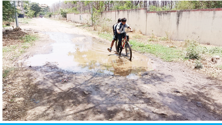
श्रीरामपूर : शिक्षण हा भविष्यातील विकासाचा राजमार्ग... पण श्रीरामपुरात शाळेत जाताना मुलांना गटारीच्या पाण्यातून ये जा करावी लागते. रथत शैक्षणिक संकुलाच्या पाठीमागील बोरावकेनगरकडे जाणाऱ्या रस्त्यावर गटारीचे पाणी साचल्यामुळे विद्यार्थ्यांना व पालकांना मनस्ताप सहन करावा लागतो.