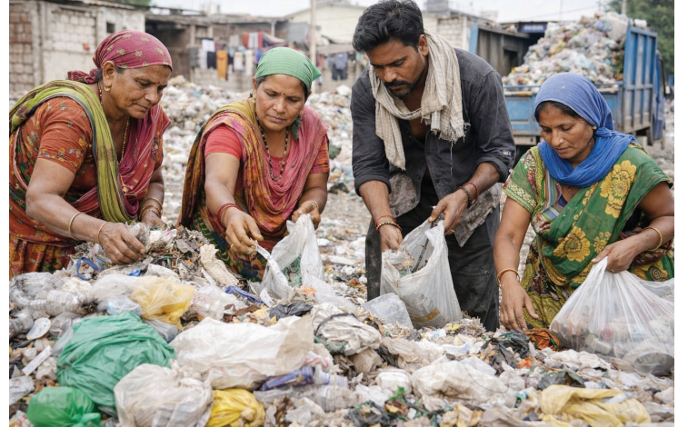
विकला जात असल्याने स्थानिक कचरा वेचकांच्या हाताला काम उरलेले नाही.

प्रतिनिधी । राष्ट्र सह्याद्री अहिल्यानगर : शहर स्वच्छ ठेवण्यासाठी दररोज पहाटेपासून मेहनत करणाऱ्या कचरा वेचक बांधवांचे आयुष्य सध्या मोठ्या संकटातून जात आहे. प्लास्टिक, कागद, काच गोळा करून दिवसाची गुजराण करणाऱ्या या कष्टकरी कुटुंबांसाठी आता जगणं कठीण बनले आहे. पूर्वी शहरातील कचरा गाड्यांमधून मिळणारा सुका कचरा हा त्यांच्या उपजीविकेचा मुख्य आधार होता. त्या कचऱ्यातून मिळणाऱ्या थोड्याफार उत्पन्नावरच त्यांच्या घरातील चूल पेटायची. पण आता हीच कमाईची वाट बंद झाली आहे. कचरा गाड्यांवरिल सुका कचरा थेट इतरांकडून गोळा करून