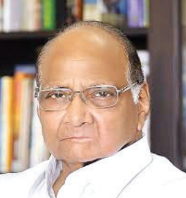
काही व्यक्तींचा अत्यंत प्रभाव आहे. त्यातील एक म्हणजे माझी आई. त्याकाळी जिल्हा लोक बोर्डात महिला प्रतिनिधीसाठी एक जागा असायची. त्या जागेवरून संपूर्ण जिल्ह्यातून माझी आई निवडून आली होती. तिचे वैशिष्ट्य म्हणजे ती एकही बैठक चुकवायची नाही. अभ्यास करून जायची. त्याकाळी प्रवासाची साधने नसायची. खासगी मोटर सर्व्हिस होती, एसटी नसायची, असे शरद पवार यांनी म्हटले. (पान ४ वर)

मुंबई : वारकरी संप्रदायात प्रतिगामी विचारासुरांच्या लोकांची घुसखोरी झाल्याचे प्रतिपादन राज्यसभा खासदार आणि ज्येष्ठ नेते शरद पवार यांनी केले. महिला शासकीय अधिकाऱ्यांच्या अखिल भारतीय साहित्य संमेलनाभिमित प्रकाशित स्मरणिकेत शरद पवार यांच्याकडून याबाबत भाष्य करण्यात आले आहे. वारकरी संप्रदायात ६० टक्के लोकांची मांडणी धर्मांध शक्तींना बळ देणारी असल्याचे मत शरद पवारांनी मांडले. दुर्दैवाने या प्रबोधनाच्या मार्गावर कुठे महिला नाहीत, असल्याची खंतही शरद पवार यांनी व्यक्त केली. महिला अधिकाऱ्यांचे पहिले अखिल भारतीय साहित्य संमेलन शनिवारी दिहिले पार पडत आहे. थोड्याच वेळात ग्रंथदिंडीला