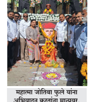
महात्मा जोतिबा फुले यांना अभिवादन करताना मान्यवर.

या मुलीने महात्मा जोतिबा फुले यांच्या जीवन कार्यावर नोंगट व्यक्त केले. देशभक्तीपर व सामाजिक, धार्मिक गीते आपल्या बंड पथकाकडे चाऊस ब्रास बंड यांनी सादर केली. शिव-फुले-शाहू-आंबेडकर समितीच्या वतीने विविध कार्यक्रम या निमित्ताने संपन्न झाले. शहरातील सर्व थरातील नागरिक व महिला, लोकप्रतिनिधी मोठ्या संख्येने उपस्थित होते.