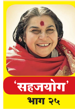
'सहजयोग' भाग २५