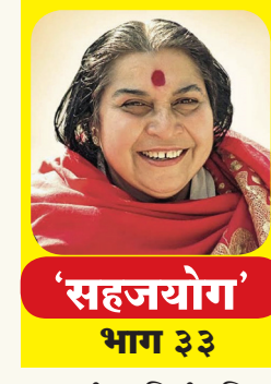
'सहजयोग' भाग ३३

परमेश्वर ही बाजारात विकत मिळणारी वस्तू नाही आणि जो परमेश्वराचा खरा मार्ग दाखवतो, तो कधीही पैशाची मागणी करत नाही. १८ डिसेंबर १९७६ रोजी मुंबईतील भाषणात श्री माताजींनी हाच मोलाचा संदेश दिला होता. आजच्या काळात 'धर्म'च्या नावाखाली होणारी लूट थांबवणे ही काळाची गरज आहे. जर कोणी अध्यात्मासाठी पैसे मागत असेल, तर तो मार्ग ईश्वराचा असू शकत नाही. शहरांच्या तुलनेत ग्रामीण भागातील आरोग्य उत्तम असण्याचे कारण म्हणजे तिथली शुद्ध हवा आणि लोकांची पवित्र मने. याच पावित्र्याला 'सहजयोग' शास्त्रीय बैठक देतो. सहजयोगाद्वारे जेव्हा तुमची सुप्त 'कुंडलिनी' शक्ती जागृत होते, तेव्हा तुम्हाला आत्मसाक्षात्कार प्राप्त होतो. ही प्रक्रिया एखाद्या बीजाच्या अंकुरण्याइतकीच नैसर्गिक आणि सहज आहे. यासाठी कोणतीही शारीरिक मेहनत किंवा पैशांची गरज नसते. एकदा का तुम्ही या स्थितीत स्थिरावलात की, तुमचे शारीरिक आणि मानसिक आजार मुळापासून नाहीसे होतात. औषधे आणि डॉक्टरांवरील अवलंबित्व कमी होऊन जीवनात खऱ्या समाधानाचा उगम होतो. स्वतःमधील चैतन्याला जागृत करून निरामय जीवनाकडे वाटचाल करण्याचा हा एक विनामूल्य आणि राजमार्ग आहे.