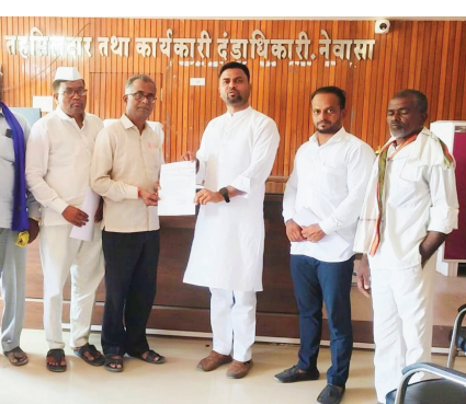
समावेश नाही. तसेच समितीचा अहवाल जनतेसमोर सादर न करता केवळ आक्षेप मागितले जात आहे. याशिवाय अत्यंत घाई घाईत प्रक्रिया पूर्ण करण्याचा सपाटा लावला जात आहे. या सर्व गोष्टी संशयस्पद असल्यामुळे ही उपवर्गीकरण प्रक्रिया तात्काळ स्थगित करण्यात यावी. अशी मागणी करण्यात आली. यावेळी दिलेल्या निवेदनात उपवर्गीकरण समितीचा अहवाल सार्वजनिक करण्यात यावा, राज्यभरात जगसुनावण्या घेण्यात याव्या. व जनतेची मते विचारात घेण्यात यावी, सर्व आक्षेप, सूचना विचारात घ्याव्यात व नंतरच अंतिम निर्णय घ्यावा. या

प्रतिनिधी | राष्ट्र सह्याद्री नेवासा : महाराष्ट्र शासनाने दहा एप्रिल रोजी अनुसूचित जातीच्या आरक्षणामध्ये उपवर्गीकरण करण्याची प्रक्रिया सुरू केली आहे. ही प्रक्रिया तातडीने बंद करण्याचे निवेदन नेवासा काँग्रेस व वंचित बहुजन आघाडीने तहसीलदार यांना दिले. राज्य सरकारने सुरू केलेल्या उपवर्गीकरण प्रक्रियेमुळे अनुसूचित जातीमध्ये तीव्र असंतोष निर्माण झाला आहे. आरक्षणाच्या प्रक्रियेत बदल करताना पारदर्शकता, न्याय, आणि सर्वसमावेशक प्रक्रिया अपेक्षित असते, दुर्दैवाने सध्या सुरू असलेल्या उपवर्गीकरण प्रक्रियामध्ये पारदर्शकता दिसून येत नाही. उपवर्गीकरणासाठी केवळ प्रशासकीय अधिकाऱ्यांची समिती स्थापन केलेली असून यात समाजाचा एकही प्रतिनिधी यात समावेश नाही. तसेच समितीचा अहवाल जनतेसमोर सादर न करता केवळ आक्षेप मागितले जात आहे. याशिवाय अत्यंत घाई घाईत प्रक्रिया पूर्ण करण्याचा सपाटा लावला जात आहे. या सर्व गोष्टी संशयस्पद असल्यामुळे ही उपवर्गीकरण प्रक्रिया तात्काळ स्थगित करण्यात यावी. अशी मागणी करण्यात आली. यावेळी दिलेल्या निवेदनात उपवर्गीकरण समितीचा अहवाल सार्वजनिक करण्यात यावा, राज्यभरात जगसुनावण्या घेण्यात याव्या. व जनतेची मते विचारात घेण्यात यावी, सर्व आक्षेप, सूचना विचारात घ्याव्यात व नंतरच अंतिम निर्णय घ्यावा. या