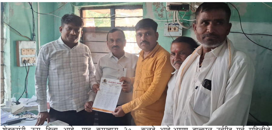
शेतकरांनी ऊस दिला आहे. मात्र कारखाना २० फेब्रुवारी रोजी बंद होऊनही, आज २० एप्रिल पर्यंत मात्र १६ जानेवारी-पर्यंतच्या शेतकरांचे पैसे दिले, असल्याचे कळते आहे. आपण तात्काळ उर्वरित सर्व राहिलीले २० फेब्रुवारी पर्यंतचे सर्व थकित बिले, एक रकमी अदा करण्याचा अनुषंगाने तात्काळ निर्णय घेऊन घ्या

प्रतिनिधी | राष्ट्र सह्याद्री गंगापूर : तालुक्यातील संजीवनी ठरलेल्या गंगापूर सहकारी साखर कारखाना गेल्या अनेक वर्षांपासून बंद असताना, संभाजी ब्रिगेडच्या माध्यमातून शेतकरी कृती समिती हे शेतकरांच्या समन्वयाचे मंच तयार करून, कारखाना शेतकरी हितासाठी चालू व्हावा, यासाठी सातत्याने पाठपुरावा केल्याने जय हिंद शुगर मिल्स तर्फे गेल्या तीन वर्षांपासून सदरील कारखाना सुरू झाला आहे. हा कारखाना सुरळीतपणे चालावा या दृष्टिकोनातून मुकेश्वर शुगर मिल्स धामोरी आणि पैठण परिसरातील अनेक शेतकऱ्यांना ऊस देण्यासाठी, आम्ही शेतकऱ्यांमध्ये विश्वासार्हता निर्माण करत जाणूती केली होती की, आपल्या तालुक्याचा कारखाना कायम चालू राहण्यासाठी ऊस देऊन सहकार्य करा, आणणिस इतर कारखान्यांचा तुलनेत भाव देऊ, तरी आपल्या कारखानाचा भाव कमी असतानाही सकारात्मक दृष्टिने