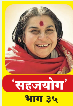
'सहजयोग' भाग ३५

संपादक : काकासाहेब नवले | RNI No. MAHMAR/2019/82605 | वर्ष ७ वे | पाने ८ | मुल्य रु. ४.०० | अंक १९० | गुरुवार २३ एप्रिल २०२६ पोस्टल परवाना : G-2/Rashtra Shyadri/RNP/2025-26 8282 | www.rashtrasahyadri.com