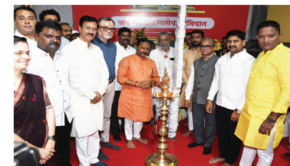
श्रीमंत दगडूशेट हलवाई सार्वजनिक गणपती ट्रस्ट तर्फे साकारलेल्या मोफत आरोग्य सेवा केंद्राचे लोकार्पण झाले. सारसबागेजवळील बाबुराव सणस मैदानासमोर असलेल्या हिरावाग कोठी परिसरात हे केंद्र उभारण्यात आले आहे. यावेळी उपस्थित मान्यवर.

पुणे : रुग्णसेवा हीच ईश्वरसेवा हे ब्रीद अंगिकारून सारत्यांना समाजासाठी कार्यरत असलेल्या श्रीमंत दगडूशेट हलवाई सार्वजनिक गणपती ट्रस्ट तर्फे साकारलेल्या मोफत आरोग्य सेवा केंद्राचे लोकार्पण झाले. सारसबागेजवळील बाबुराव सणस मैदानासमोर असलेल्या हिरावाग कोठी परिसरात हे केंद्र उभारण्यात आले आहे. यामध्ये रुग्णांना विविध प्रकारच्या तपासणी, औषधे व श्रवणयंत्र, कृत्रिम अवयव मोफत मिळणार आहेत.