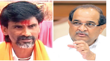
प्रतिनिधी। राष्ट्र सह्याद्री

कोणताही आवश्यकता नाही, अशी स्पष्ट भूमिका महसूल मंत्री तथा उपसमितिके अध्यक्ष राधाकृष्ण विखे पाटील यांनी मांडली आहे. मनोज जरांगे पाटील यांनी त्यांच्या कार्यपद्धतीवर केलेल्या टीकेला उत्तर देताना त्यांनी ही माहिती दिली.