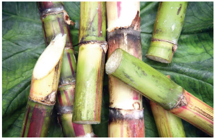
प्रतिनिधी। राष्ट्र सह्याद्री

मुंबई : देशातील ऊस उत्पादक शेतकऱ्यांसाठी केंद्र सरकारने एक ऐतिहासिक पाऊल उचलले आहे. तब्बल ६० वर्षांपासून लागू असलेला १९६६ चा जुना 'ऊस नियंत्रण आदेश' रद्द करून त्याजागी