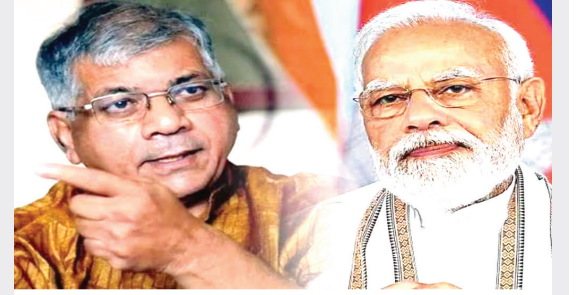
प्रतिनिधी। राष्ट्र सह्याद्री

या सर्व पार्श्वभूमीवर, अमेरिकेला पंतप्रधान मोदींच्या अशा कोणत्या 'काळ्या कारनाम्यांची' माहिती आहे, ज्यामुळे ते सातत्याने होणारी ही बेइज्जती गप्प बसून सहन करत आहेत, असा थेट सवाल त्यांनी उपस्थित केला आहे. या ट्विटच्या माध्यमातून त्यांनी पंतप्रधानांच्या मौनाचा खरपूस समाचार घेतला.