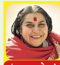
'सहजयोग' भाग ३७