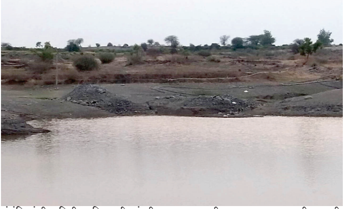
संबंधितांची माहिती आणि नागरिकांवरील अन्यायाचे दस्तऐवजीकरण मांडले जाणार आहे. पुढील उच्च न्यायालयासह न्यायालयीन लढा उभारण्याची तयारी संघटनेने दर्शविली असून, गरज पडल्यास राज्यव्यापी आंदोलन छेडण्याचाही इशारा देण्यात आला आहे.

आणि नियमबाह्य सिंचनामुळे वैध लाभार्थी शेतकरी पाण्याअभावी त्रस्त झाले आहेत. विहिरींची पातळी घटत असून, झिरणूक सिंचनासाठी आवश्यक पाणीही कमी झाले आहे. याचा शेती उत्पादनावर प्रतिकूल परिणाम होत असल्याचे संघटनेने नमूद केले आहे. ही सार्वजनिक जलसंपत्तीची लूट असून ग्रामीण अर्थव्यवस्थेला मोठा फटका बसत आहे, असा आरोप करण्यात आला आहे. प्रशासनाच्या भूमिकेवरही प्रश्नचिन्ह उपस्थित करत अवैध मोटारी सुरू कशा? वीज जोडण्या का तोडल्या जात नाहीत? असे सवाल उपस्थित करण्यात आले आहेत. दोषींवर कठोर कारवाई करण्याची मागणी संघटनेने केली आहे. दरम्यान, १ मे रोजी प्रसिद्ध होणाऱ्या 'रेड गॅझेट'मध्ये या प्रकरणाचे पुरावे,