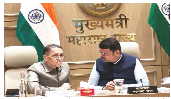
मंदत होणार आहे. आगामी सिंहेस्थ कुंभमेळा २०२७ च्या पार्श्वभूमीवर भीमाशंकर परिसरात अखंडित वीज पुरवठ्यासाठी डिंबे येथे ३३/११ क्वेडी. उप केंद्र उभारण्याची गरज ही अधोरेखित करण्यात आली. यासाठी जलसंपदा विभागाची जमीन महावितरणकडे हस्तांतरित करून प्रस्ताव मंत्रिमंडळासमोर सादर करण्याची विनंती करण्यात आली.

प्रतिनिधी । राष्ट्र सह्याद्री डिंबे/कवठे येमाई : आंबेगाव-शिरूर मतदारसंघातील विविध प्रलंबित विकासकामांना गती देण्यासाठी माजी मंत्री तथा आमदार दिलीप वळसे-पाटील यांनी मुख्यमंत्री देवेंद्र फडणवीस यांची नुकतीच मुंबई येथे भेट घेतली. या भेटीत सिंचन, पाणीपुरवठा, वीज आणि आगामी कुंभमेळ्याच्या पार्श्वभूमीवर आवश्यक पायाभूत सुविधाबाबत सविस्तर चर्चा झाली. मुख्यमंत्र्यांनी सर्व मुद्द्यांवर सकारात्मक प्रतिसाद देत लवकर कार्यवाही करण्याचे आश्वासन दिले. कुकूट प्रकल्पातील महत्त्वाचे डिंबे धरण सुरक्षिततेचा प्रश्न या बैठकीत अग्रक्रमाने मांडण्यात आला. धरणातून होत असलेली गळती थांबवण्यासाठी १७१.५९ कोटी रुपयांचा प्रस्ताव तयार असून त्याला तातडीने प्रशासकीय मान्यता देण्याची मागणी करण्यात आली. यामुळे धरणाचे आयुष्य वाढवण्यास आणि भविष्यातील संभाव्य धोका टाळण्यास