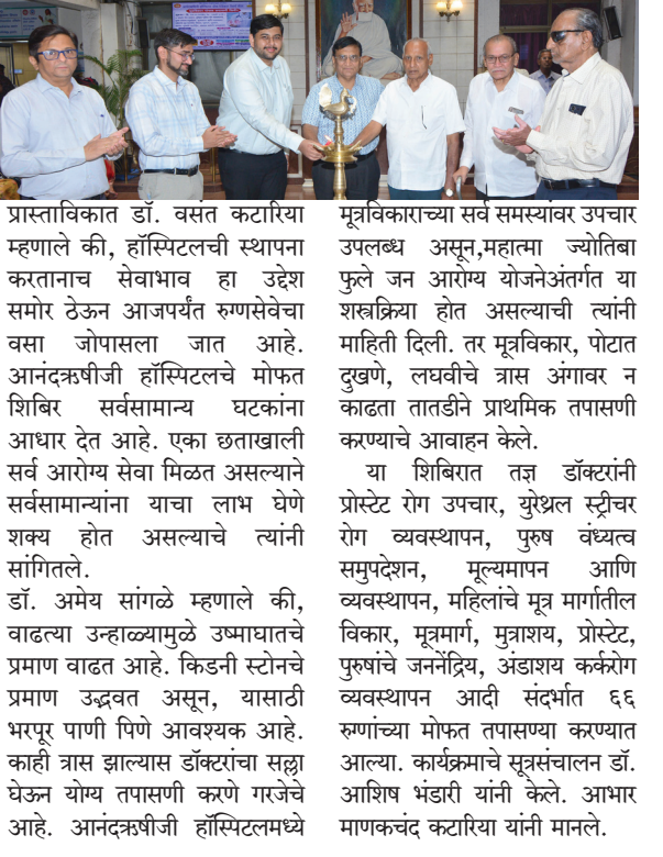
मूत्रविकाराच्या सर्व समस्यांवर उपचार उपलब्ध असून,महात्मा ज्योतिबा फुले जन आरोग्य योजनेअंतर्गत या शस्त्रक्रिया होत असल्याची त्यांनी माहिती दिली. तर मूत्रविकार, पोटात दुखणे, लथवीचे त्रास अंगावर न काढता तातडीने प्राथमिक तपासणी करण्याचे आवाहन केले. या शिबिरात तज्ञ डॉक्टरांनी प्रोस्टेट रोग उपचार, युरेशल स्ट्रीकर प्रमाण वाढत आहे. किडनी स्टोनचे प्रमाण उद्व्वत असून, यासाठी भरपूर पाणी पिणे आवश्यक आहे. काही त्रास झाल्यास डॉक्टरांचा सल्ला घेऊन योग्य तपासणी करणे गरजेचे आहे. आनंदक्रषीजी हॉस्पिटलमध्ये