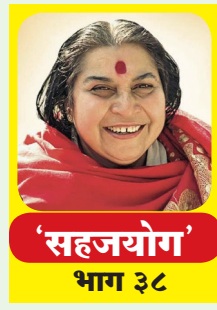
'सहयोग' भाग ३८