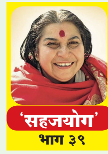
'सहजयोग' भाग ३९