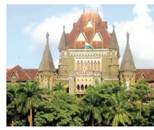
मुंबई उच्च न्यायालयाच्या शिपाई पदासाठी नुकतीच

मुंबई : मुंबई उच्च न्यायालयातील शिपाई आणि हमाल पदासाठीच्या भरती परीक्षेवरून सध्या राज्यात नवा वाद उफाळला आहे. परीक्षेच्या प्रश्नपत्रिकेत मराठीची 'राष्ट्रभाषा' कोणती, असा प्रश्न विचारण्यात आल्याने 'मराठी एकीकरण समिती'ने आक्रमक पवित्रा घेतला असून, प्रशासनाच्या या भूमिकेवर तीव्र आक्षेप नोंदवला आहे.