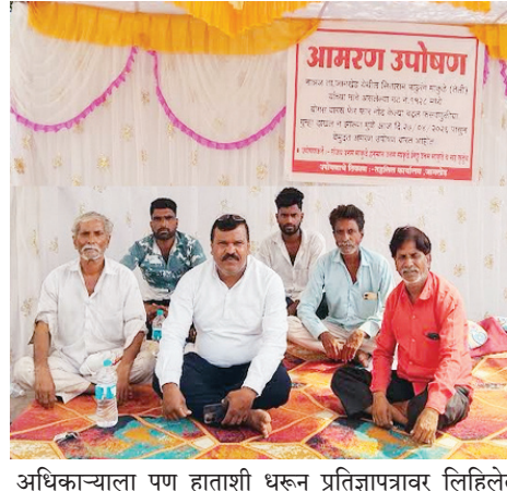
अधिकार्याला पण हाताशी धरून प्रतिज्ञापत्रावर लिहिलेले सर्व व्यक्ती हजर नसतानाही प्रतिज्ञापत्रावर पदाचा गैरवापर करून जामखेड तहसील कार्यालयातील अधिकार्याने भ्रष्ट मार्गाने सही केली आहे तरी वरील सर्व प्रकरणाची