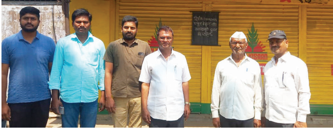
कृषी निविद्या विक्रेत्यांनी शासनाकडे विविध मागण्या साठी पुकारलेल्या बंदला कोल्हार भगवतीपुर परिसरात शंभर टक्के प्रतिसाद मिळाला.

गणेश कुमकर्ण | राष्ट्र सह्याद्री कोल्हार : कंपन्यांकडून रासायनिक खताचा पुरवठा होताना होणारे लिंकिंग बंद करावे, शेजारील राज्यातून येणाऱ्या अप्रामाणीत कापूस (कॅड्ड) बियाण्यावर बंदी आणवी, प्रमाणित बियाण्यासंबंधीसाठी पोर्टलचा वापर विक्रेत्यांवर सक्ती न करता उत्पादक व पुरवठादार कंपनी स्तरावरच राबवणे, रासायनिक खताचा पुरवठा (क्राउट) पद्धतीने करावा, रासायनिक खताच्या विक्री मार्जिन मध्ये वाढ करावी, विक्रेते बियाणे पुरवठादार कंपन्यांकडून