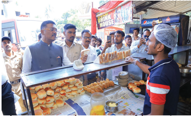
लोणावळा बसस्थानकावर येणाऱ्या काही बसफेऱ्या बसस्थानकात न येता पुढे जात असल्याची तसेच काही बसेस जाणीवपूर्वक खाजगी हॉटेलींवर थांबत असल्याची तक्रार प्रवाशांनी यावेळी मांडली. या हॉटेलींवर महागडे खाद्यपदार्थ प्रवाशांना परवडत नसल्यामुळे, वेळापत्रकातील सर्व बसफेऱ्या नाराऱ्यांसाठी लोणावळा बसस्थानकावरच थांबल्यात, अशी मागणी प्रवाशांनी केली. त्यानुसार, कोणतीही बस खाजगी हॉटेलींवर न थांबता नियोजित वेळापत्रकानुसार लोणावळा बसस्थानकावरच थांबवी, असे स्पष्ट निर्देश त्यांनी एसटी

पुणे : उन्हाळ्यात बसस्थानकावर येणाऱ्या प्रवाशांना 'नाथजल'चे थंडगार पाणी केवळ १५ रुपयांना मिळाले पाहिजे. किंमत वाढवून विक्री करताना आढळल्यास संबंधितांचा विक्री परवाना रद्द केला जाईल, असा इशारा परिवहन मंत्री तथा एसटी महामंडळाचे अध्यक्ष प्रताप सरनाईक यांनी दिला. परिवहन मंत्री तथा महाराष्ट्र राज्य मार्ग परिवहन महामंडळाचे अध्यक्ष प्रताप सरनाईक यांनी आज सकाळी पुणे विभागातील लोणावळा बसस्थानकास भेट देऊन तेथील प्रवासी सेवा-सुविधांची प्रत्यक्ष पाहणी केली. यावेळी त्यांनी प्रवाशांशी संवाद साधला असता, बसस्थानकावर विक्री होत असलेली 'नाथजल'ची एक लिटरची थंड पाण्याची बाटली २० रुपयांच्या वाढीव दराने विकली जात असल्याचे त्यांच्या निदर्शनास आले. यावर त्यांनी संबंधित विक्रेत्यास स्पष्ट दफतरक लावण्याच्या सूचना देत, पुढे १५ रुपयांची बाटली अधिक दराने विक्री केल्यास विक्री परवाना रद्द केला जाईल, असा इशारा दिला. तसेच,