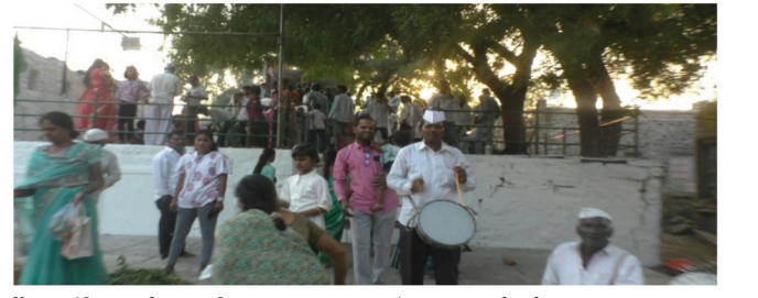
बर्डे, पंडित पीटेकर, विलास सकट, यांनी परिश्रम घेतले.