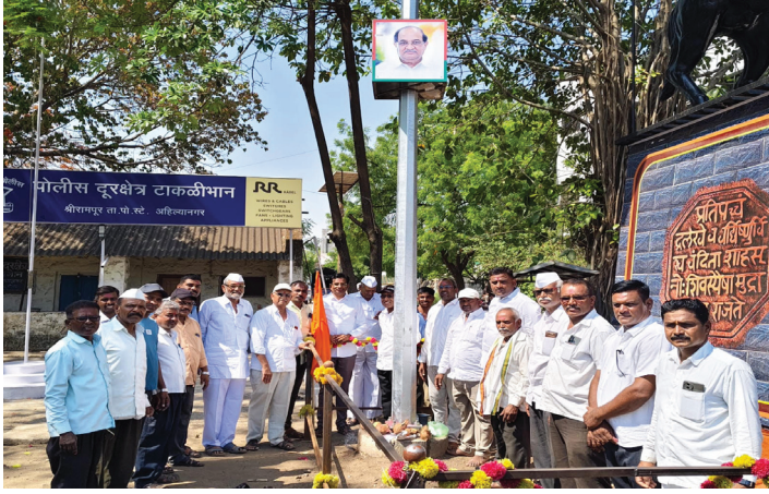
यांच्या निधीतून टाकळीभानला भरघोस लोकार्पण आहे. यावेळी सर्व ओढ्याचे असा निधी मिळाला आहे तसेच लवकरच घरकुल जागेचा प्रश्नही मार्गी