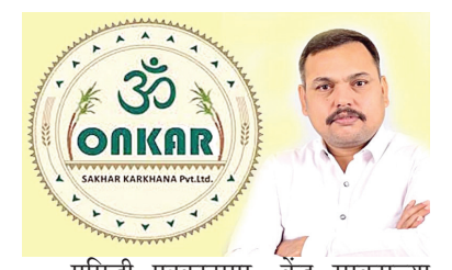
प्रसिद्धी पत्रकानुसार, केंद्र सरकारच्या नव्या धोरणामुळे पेट्रोल-डिझेलमध्ये ३३ टक्के इथेनॉल मिश्रण करण्याचा निर्णय झाल्याने यावर्षीचे इथेनॉल आणि मोलॅसिस अद्याप विक्री झाले नसल्याचे नमूद करण्यात आले आहे. त्यामुळे उद्योग(पान ४ वर)

ऑंकार उद्योग समूहाचे प्रसिद्धी पत्रक; शेतकऱ्यांमध्ये आशेचे वातावरण सोशल मीडियावर बदनामी करणाऱ्यांविरोधात गुन्हे दाखल प्रतिनिधी | राष्ट्र सहाद्री अहिल्यानगर : ऑंकार शुगर उद्योग समूह पुढील आठवड्यापासून ऊस उत्पादक शेतकरी, कामगार आणि वाहतूकदारांची थकीत देणी अदा करण्यास सुरुवात करणार असल्याची माहिती उद्योग समूहाच्या वतीने प्रसिद्ध करण्यात आलेल्या अधिकृत पत्रकाद्वारे देण्यात आली आहे. दैनिक राष्ट्र सहाद्रीने उद्योग समूहाच्या आर्थिक अडचणी आणि शेतकऱ्यांच्या थकीत देयकाबाबत वृत्त प्रसिद्ध केल्यानंतर हे स्पष्टीकरण समोर आल्याने शेतकऱ्यांमध्ये आशादायक वातावरण निर्माण झाले आहे. अहिल्यानगर : ऑंकार शुगर उद्योग समूह पुढील आठवड्यापासून ऊस उत्पादक शेतकरी, कामगार आणि वाहतूकदारांची थकीत देणी अदा करण्यास सुरुवात करणार असल्याची माहिती उद्योग समूहाच्या वतीने प्रसिद्ध करण्यात आलेल्या अधिकृत पत्रकाद्वारे देण्यात आली आहे. दैनिक राष्ट्र सहाद्रीने उद्योग समूहाच्या आर्थिक अडचणी आणि शेतकऱ्यांच्या थकीत देयकाबाबत वृत्त प्रसिद्ध केल्यानंतर हे स्पष्टीकरण समोर आल्याने शेतकऱ्यांमध्ये आशादायक वातावरण निर्माण झाले आहे.