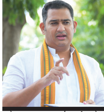
कोपरगाव तालुक्याच्या पूर्व भागातील अनेक गावांतील व्यापारी, शेतकरी व नागरिकांना