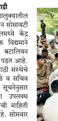
शाळातील इयत्ता ८ वी व ९ वी आणि १५ वी व १२ वी आणि वरिष्ठ महाविद्यालयाच्या एनसीसीच्या यामध्ये २६२ मुले आणि १४०