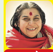
'सहजयोग' भाग ५४

आत्मसाक्षात्काराशिवाय तुम्ही सत्याला जाणून घेऊ शकत नाही. तुम्ही आनंदाला प्राप्त करू शकत नाही. आत्म्याची अनुभूती होणे अत्यंत आवश्यक आहे. आता तुम्ही आत्म्याशी संवाद साधू शकता, आत्म्याला विचारू शकता. जोपर्यंत तुम्ही तुमच्या आत्म्याची अनुभूती घेत नाही, तोपर्यंत तुम्ही कोणतेही सत्य जाणून घेऊ शकत नाही. म्हणजेच, जोपर्यंत तुमचा त्याच्याशी संबंध जोडला जात नाही. सहजयोगामुळे आत्म्याशी संबंध जोडणे अत्यंत सोपे होते. काही जणांना तो थोडा वेळासाठी होतो, तर काही जणांना तो कायमचा होतो. आत्म्याशी संबंध जोडल्यानंतर आपल्याला त्याच्याशी तादात्म्य पावावे लागते. म्हणजेच, तुम्ही मला ओळखले, ठीक आहे; तुम्ही मला जाणले, ठीक आहे; पण मी काही तुम्ही झालेली नाही. मी तुम्हाला पाहत आहे आणि तुम्ही मला पाहत आहात. या क्षणी मी जर तुमच्या दृष्टीने पाहू शकले, तर त्याच क्षणी तादात्म्य झाले. आत्म्याशी तदाकार (एकरूप) होण्यासाठी, सर्वांत आधी 'मी नाही' असे मानले पाहिजे. - २८ डिसेंबर १९७७ मुंबई www.sahajyogamumbai.org 8871519191 सौजन्य: निर्मला धाम आश्रम, आरडगाव राहूरी