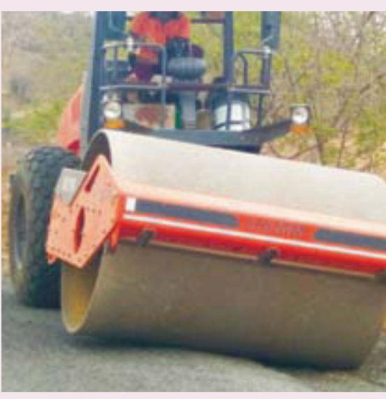
अण्णांच्या हस्तक्षेपांनंतर रखडलेल्या रस्त्याच्या कामाला गती गेल्या दोन वर्षांपासून प्रलंबित असलेल्या जातेगाव-राळेगण सिध्दी रस्त्याच्या कामामुळे