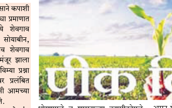
धोरणामुळे व शासनाच्या उदासीनतेमुळे शेतकरी विम्या पासून अजूनही वंचित आहेत. सद्यस्थितीत मागील वर्षी ऑगस्ट खरी परंतु ती पुर्णपणे फोल ठरली असून मागील वर्षी प्रत्यक्षात नुकसान होऊनही विमा कंपनीच्या आडमुठ्या धोरणामुळे कपाशी तुर या पिकांचे मोठ्या प्रमाणात नुकसान होऊनही विमा कंपनीच्या टुप्प्या या पिकांला विमा मंजूर करण्यात आला

असून शेवगांव तालुका पांढ-या सोन्याच कोटार म्हणून ओळखले जाते परिसरात शेतकरी जिरायती व बागायती कापुसराचे तसेच तुरीचे पीक मोठ्या प्रमाणात घेतले जाते मात्र प्रत्यक्षात तालुक्यामध्ये कपाशी तुरी सारख्या पिकांचा पीक विमा मोठ्या प्रमाणात शेतकऱ्यांनी उतरविला असला तरी विमा कंपनीने या दोन पिका वित्तिक अन्य पीकाचा विमा मंजूर करण्यात आला