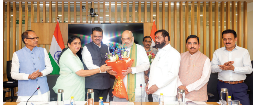
सहकारमंत्री अमित शाह यांची भेट घेतली. या बैठकीत राज्यातील सहकारी साखर कारखान्यांची आर्थिक अडचण, वाढलेला उत्पादन खर्च, निर्यात प्रश्न आणि शेतकऱ्यांच्या एफआरपी

मुंबई : अहिल्यानगरसह राज्यातील ऊस उत्पादक शेतकरी, सहकारी साखर कारखाने आणि ग्रामीण अर्थव्यवस्थेसाठी महत्त्वाची ठरणारी बैठक दिल्लीत पार पडली असून, साखरेच्या किमान विक्री दरवाढीपासून (एमएसपी) ते साखर कारखान्यांच्या कर्ज पुनर्गठनापर्यंतच्या मुद्द्यांवर केंद्र सरकार पुढील दहा दिवसांत निर्णय घेणार असल्याचे आश्वासन केंद्रीय गृहमंत्री अमित शाह यांनी दिले.