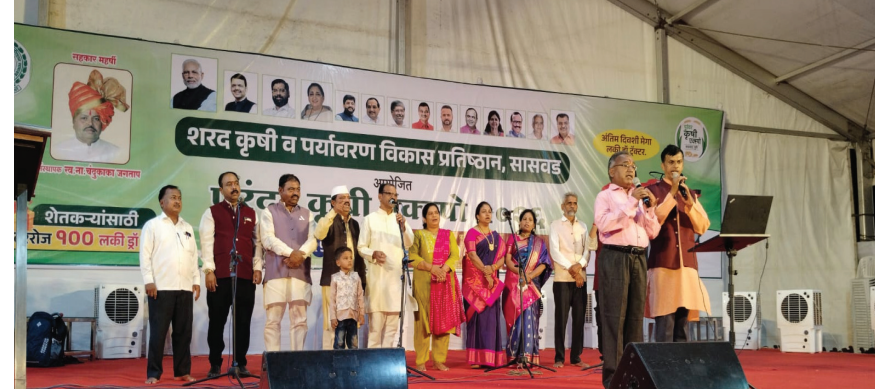
महाराष्ट्र गीत सादर करताना कलामंचचे कलाकार