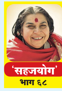
'सहजयोग' भाग ६८

आपल्यामध्ये हे देवपण आलेले आहे आपल्यामध्ये. तुम्हाला बालकिष्ठा दिलेला आहे जो तुमच्याच आत्ममध्ये आहे. तो म्हणजे निर्विचार स्थिती. थॉटलेस अवेअरनेस. तुम्ही जर त्या किष्ठावर बसलात तर कोणाची हिम्मत नाही तिथे पाय ठेवायची! हे लक्षात ठेवा.