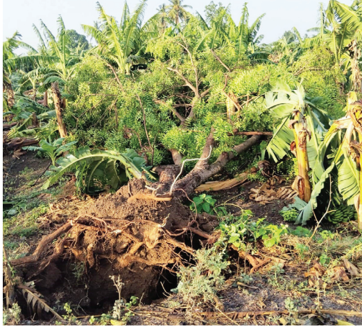
प्रतिनिधी । राष्ट्र सहाद्री जिल्ह्यात सुरु झालेलं पानेगाव : दि. ३१ रोजी अवकाळीचं तांडव रात्री ९ सायंकाळी ७ वाजता जवळपास वाजता थांबलं नेवासा खुपटी रोड

केळीच्याबागा भुईसपाट वीजपुरवठा खंडित । नेवासा - खुपटी रस्ता झाडे पडल्याने बंद