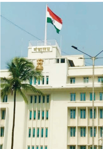
नाही तसेच बदलीस पात्र असतानाही शिक्षकांच्या बदल्या शासनाने एकतर्फी थांबविल्या आहेत.

जनगणनेत नाहीत अशा पेसा सारख्या अवघडक्षेत्रात काम करणाऱ्या आणि बदलीपात्र शिक्षक कर्मचाऱ्यांच्या बदल्या थांबविल्याने शिक्षकांमध्ये प्रचंड असंतोष धगधगत आहे. जनगणनेचे काम नको, अशी राज्यभर शिक्षक कर्मचाऱ्यांकडून मागणी होत असताना बदलीपात्र महाभाग शिक्षकांनी पेसा क्षेत्रात बदल्या होऊ नये यासाठी जनगणनेचे काम मुद्दामहून मागून घेतले आहे. राज्य शासनाच्या महसूल नगर विकास आणि आदिवासी विभागांतर्गत राज्यभर सध्या मोठ्या प्रमाणात बदल्या सत्र सुरू आहे. केवळ शिक्षकांच्या बदल्या करण्यास शासनाने नकार दिला आहे. शासनाने या संदर्भात अंतर्मुख व्हावे, अशी मागणी शिक्षकांनी केली आहे. जे शिक्षक जनगणनेच्या कामात आहेत आणि ज्यांना हे काम शासनाने दिले