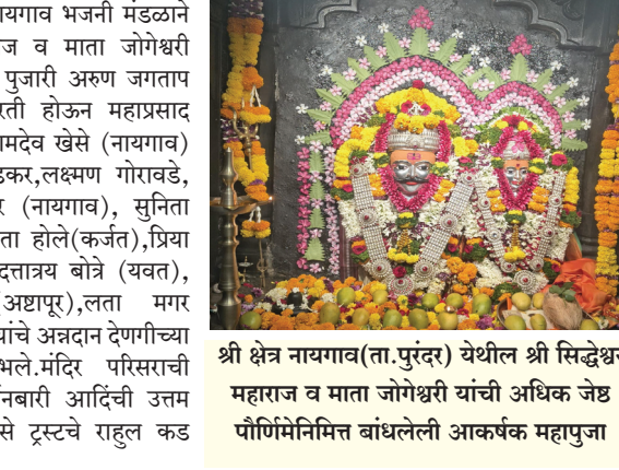
श्री क्षेत्र नायगाव(ता.पुरंदर) येथील श्री सिद्धेश्वर महाराज व माता जोगेश्वरी यांची अधिक जेठ पौर्णिमेनिमित्त बांधलेली आकर्षक महापुजा