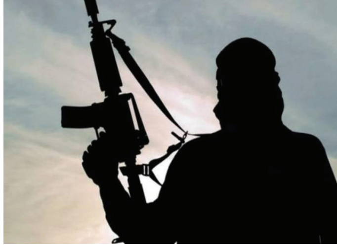
केले असून, त्यांचा पाकिस्तानातील देशद्रोहांशी असलेला डिजिटल संबंध पूर्णपणे उघड करण्यासाठी युद्धपातळीवर तपास सुरू आहे.

एटीएसच्या मुंबई, नाशिक आणि स्थानिक पथकांनी काल पहाटेपासून श्रीरामपूर शहरातील तब्बल ७ ते ८ संशयास्पद ठिकाणांना वेढा घालत एकाच वेळी छापे टाकले. संशयितांना ताब्यात घेतल्यानंतर त्यांच्या मोबाईलची कसून तपासणी करण्यात आली. या मोबाईलमधील चॅट्स, ऑडिओ क्लिप्स आणि सोशल मीडियाचा आक्षेपार्ह डेटा पाहून तपास अधिकाऱ्यांचेही डोळे पांढरे झाल्याचे समजते. एटीएसने संशयितांचे मोबाईल आणि इलेक्ट्रॉनिक उपकरणे पुढील फॉरेंसिक तपासासाठी जप्त