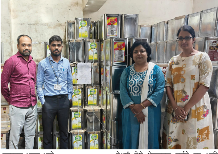
करण्यात आला आहे.

सातारा जिल्ह्यात १ जून रोजी गोडोली, सातारा येथील मेसर्स धन्वंतरी डिस्ट्रीब्यूटर्स प्रा.लि. येथे केलेल्या कारवाईत प्रॉटीरिच- डब्ल्यू हबल हेल्थ ड्रिंक, चॉकलेट कंपाऊंड, सी बकथॉर्न ज्यूस याचा एकूण २१ लाख ४० हजार ९४६ रुपयांचा अन्न पदार्थ साठा जप्त