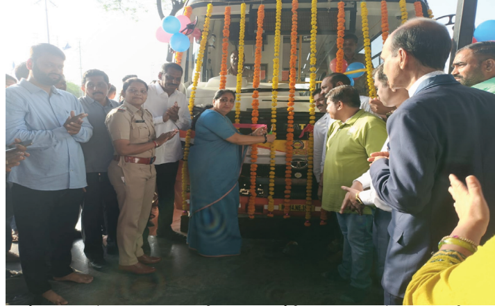
ठाकरे स्वच्छ सुंदर बसस्थानक अभियान २०२५' या अभियानात अखिल स्थान व कर्मचाऱ्यांच्या अभिमान कार्यक्रमाला पटकालव्याबद्दल बारामती बसस्थानक येथे आयोजित एसटी महामंडळाच्या अधिकारी २०२५' या अभियानात अखिल स्थान व कर्मचाऱ्यांच्या अभिमान कार्यक्रमाला पटकालव्याबद्दल बारामती बसस्थानकाला

बारामती : बारामती आगारात नव्याने दाखल करण्यात झालेल्या १० 'राजामाता जिजाऊ' या अत्याधुनिक स्मार्ट बस सेवेचे उपमुख्यमंत्री सुनेत्रा अजित पवार यांच्या हस्ते (दि.७) रोजी लोकार्पण करण्यात आले. स्वर्गीय उपमुख्यमंत्री अजित पवार यांनी बारामती तालुक्यातील पायाभूत सुविधा विकासाला नेहमीच प्राधान्य दिले. त्यापैकीच एक आणि देशात मॉडेल बनलेल्या बारामती बसस्थानकाचा परिसर, बसमधील स्वच्छता राखणे, बस वेळेवर सोडण्यासह प्रवाशांची सुरक्षितता आणि त्यांच्या समस्या सोडविण्यावर राज्य परिवहन महामंडळाने (एसटी) भर द्यावा, असे निर्देश उपमुख्यमंत्री श्रीमती पवार यांनी दिले.