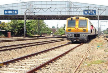
तसेच महानगरांमध्ये रेल्वे मार्गाच्या आजूबाजूला असलेले वाढते शहरीकरण लक्षात घेता अशा भागात गरजेनुसार नागरिकांच्या सुलभ दळणवळणाकरिता पायाभूत सुविधांची कामे हाती घेण्यात यावीत. मान्यता देण्यात आलेल्या

घेतला. सार्वजनिक बांधकाम राज्यमंत्री इंद्रनील नाईक व आमदार प्रसाद लाड बैठकीस उपस्थित होते. राज्यातील सार्वजनिक बांधकाम आणि नगरविकास विभागाच्या उखळ्यात असलेल्या रस्त्यांवर रेल्वे उड्डाण पूल, पादचारी पूल आणि रेल्वे मार्गाखालील (अंडर पास) रस्त्याची कामे महारेलमार्फत करण्यात येणार आहेत. त्याबाबत बैठकीत सविस्तर चर्चा झाली. त्यावेळी मुख्यमंत्री फडणवीस यांनी विविध निर्देश दिले. संपूर्ण महाराष्ट्रात एकही रेल्वे मार्गावर फाटक राहता काम नये. रेल्वे फाटक मुक्त महाराष्ट्रासाठी रेल्वे पायाभूत सुविधा उभारण्यात याव्यात;