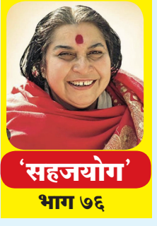
'सहजयोग' भाग ७६

कुंडलिनी आणि प्रकाश सर्व प्रथम म्हणजे आपल्या भारत भूमीला योगाचं केवढं मोठं साधन मिळालेलं आहे. परमेश्वर आपल्या हृदयात, मंदिरात बसलेला आहे. तो आपण जाणला पाहिजे. आपल्यामध्ये जो प्रकाश आहे, तो जागृत झाला पाहिजे. आपल्याला हे कळलं पाहिजे की आतमध्ये काय आहे आपल्या आणि बाहेर काय आहे. सहजयोग म्हणजे फार मोठी किमया आहे. तुम्ही काहीही पूर्वजन्मात ह्या जन्मात काहीही पाप केली असतील तरी आमच्या प्रेमामुळे ती तोडकीच आहेत. असं कोणचही पाप तुम्ही करू शकत नाही, जे आमचं प्रेम पुढून काढू शकत नाही. ही मात्र गोष्ट निर्विवाद आहे. तेव्हा त्याबद्दल मुळीच विचार करू नये, की आमच्या हातून हे पाप घडलं किंवा ते पाप घडलं. ही फार मोठी सहजयोगाची किमया पहिल्यांदा आहे की तुम्हाला तुमची कर्मभोगा वरील सहजयोग सांगत नाही. झालं संपलं आता. कर्म तरी तुमचा अहंकारच भोगतोय ना. ज्याला अहंकार नाही तो कसलं कर्म भोगतो हो. प्रकाशाशिवाय नुसत्या लेखकांसाठी काहीही कार्य होण्यासारखं नाहीय. तेव्हा तुम्ही ते मिळवा. आकुडी, ११ जानेवारी १९८० अधिक माहितीसाठी www.sahajayogamumbai.org 8871519191 सौजन्य : निर्मला धाम आश्रम, आरडगाव राहुरी