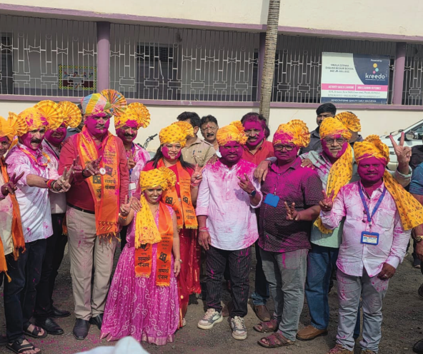
मानले. महामंडळाच्या सर्व घटकांना सोबत घेऊन पारदर्शक, विकासाभिमुख आणि सर्वसमावेशक कामकाज करण्याचा निर्धार यावेळी व्यक्त करण्यात आला.