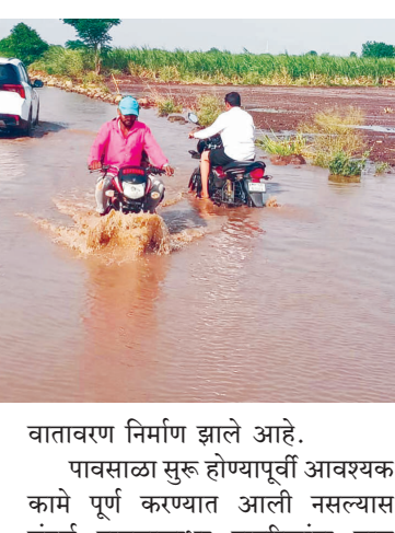
विद्यार्थ्यांना जीव धोक्यात घालून प्रवास करावा लागत आहे. चिखल, खड्डे आणि साचलेल्या पाण्यामुळे विद्यार्थ्यांसह पालकांमध्येही चिंतेचे

परिसरातील नागरिकांच्या म्हणण्यानुसार, निकट दर्जाच्या कामामुळे रस्त्यावर अनेक ठिकाणी पावसाचे पाणी साचले असून मोटमोठे खड्डे पडले आहेत. परिणामी रस्त्यांवर पाण्याची तळी निर्माण झाली असून वाहनचालक, प्रवासी आणि स्थानिक नागरिकांना मोठा त्रास सहन करावा लागत आहे. रस्ता दुरुस्तीचा केवळ देखावा करण्यात आला असून पहिल्याच पावसात कृष्णाई इन्फ्रा कंपनीचे पितळ उगडे पडले आहे, अशी तीव्र प्रतिक्रिया पहिल्याच पावसात या कामाच्या दर्जाबाबत गंभीर प्रश्न उपस्थित झाले आहेत. विशेषतः शाळेकडे जाणाऱ्या रस्त्यांवर खड्ड्यांमध्ये पाणी साचल्याने