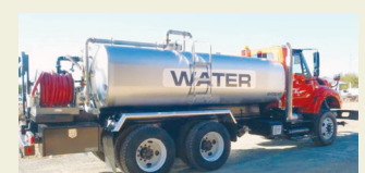
टँकरने पाणीपुरवठा सुरू असलेली गावे !

पावसाळ्याच्या उंबरठ्यावर तब्बल १५ गावांमध्ये सध्या टँकरद्वारे पाणीपुरवठा सुरू असून जेऊर आणि बावुडी या गावांकडूनही टँकर सुरू करण्यासाठी प्रशासनाकडे प्रस्ताव दाखल करण्यात आले असल्याने तालुक्यात विदारक परिस्थितीचे चित्र दिसून येत आहे. वाढते तापमान, घटलेली भूजल पातळी आणि रिकामे पडलेले विहिरी-बोअरवेल यामुळे ग्रामीण भागातील नागरिकांची चिंता वाढली आहे. पावसाळ्याचे दिवस सुरू झाले असले तरी अद्याप समाधानकारक