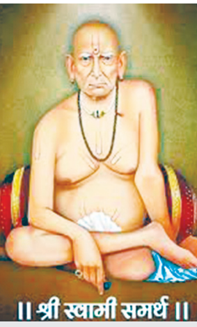
॥ श्री स्वामी समर्थ ॥

प्रतिनिधी। राष्ट्र सह्याद्री श्रीरामपूर : श्री स्वामी समर्थ महाराजांच्या पालखी व पादुका परिक्रमेचे सोमवार, दि. १५ जून रोजी श्रीरामपूर नगरीमध्ये भव्य आगमन होणार असल्याची माहिती श्री स्वामी समर्थ सेवा ट्रस्ट व स्वामी भक्त परिवाराने दिला आहे. सालाबादप्रमाणे या २८ व्या वर्षाही श्री स्वामी समर्थ ट्रस्ट अकलकोट या संस्थाने पादुका व पालखी परिक्रमेचे आयोजन केले आहे. पालखीचे श्रीरामपूर नगरीमध्ये सोमवार, दि. १५ जून रोजी भव्य आगमन झाल्यानंतर दुपारी १२ ते ३ या वेळेत श्रीरामपूर मंचट्स असोसिएशनच्या व्यापारी मंगल कार्यालयात दुपारी १२ ते ३ धार्मिक कार्यक्रमां व महाआरतीचा सोहळा होणार आहे.