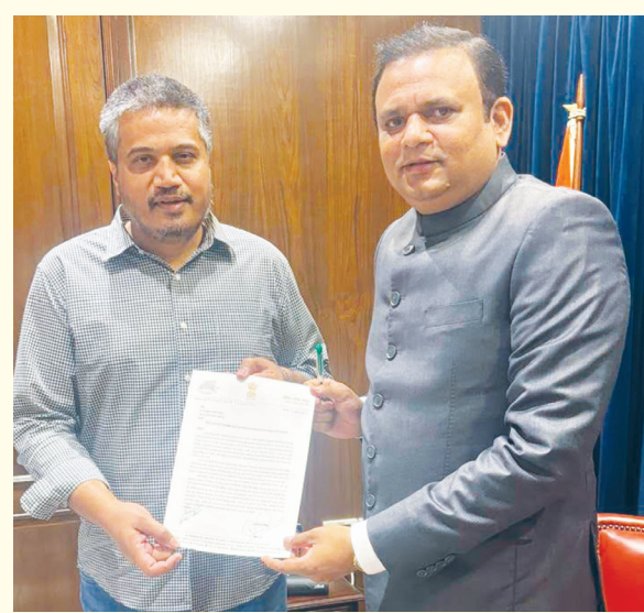
आणण्याची विनंती केली. तसेच शासनाने दिलेल्या आश्वासनानुसार