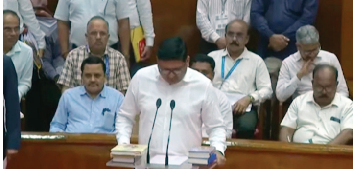
राज्याच्या विधिमंडळात अभ्यासू व प्रभावी नेतृत्वाची भर पडल्याची भावना