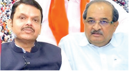
सुलभ पद्धतीने मिळण्यास मदत होणार आहे.

या स्वतंत्र कक्षामार्फत मराठा आरक्षणासंदर्भातील न्यायालयीन प्रक्रियेचा समन्वय अधिक प्रभावीपणे केला जाणार असून, शासनाची कायदेशीर बाजू सक्षमपणे मांडण्यासाठी आवश्यक माहिती, कागदपत्रे आणि कार्यवाहीला गती दिली जाणार आहे. त्यामुळे आरक्षणासंदर्भातील प्रकरणांच्या सुनावणीला अधिक बळ मिळण्याची अपेक्षा व्यक्त केली जात आहे. याशिवाय, एसईबीसी प्रवर्गातील नियुक्त्या, शिष्यवृत्ती, वसतिगृह सुविधा आणि इतर शैक्षणिक योजनांशी संबंधित प्रश्नांचे एकाच ठिकाणी समन्वय करण्यात येणार आहे. त्यामुळे विद्यार्थ्यांना शासनाच्या योजनांचा लाभ अधिक जलद आणि