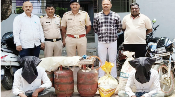
प्रतिनिधी | राष्ट्र सहाद्री