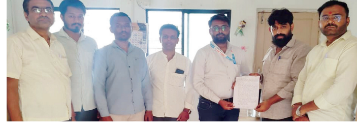
प्रतिनिधी | राष्ट्र सहाद्री

बोगस कामगार नोंदणीची तक्रार : दुचाकीच्या डिकीत सापडले इंजिनिअरचे बनावट रबरी शिके आणि बोगस दस्तावेज