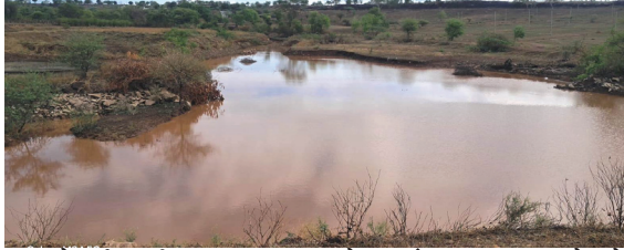
पावसाने परिसरातील वातावरणात गावठाण परिसरात ढगफुटी सदृश्य पाऊस बरसला

प्रतिनिधी । राष्ट्र सह्याद्री कवठे येमाई : सतत दुष्काळी म्हणून गणल्या जाणाऱ्या व डोंगरपट्टीवर असलेल्या शिरूर तालुक्यातील कान्हूर मेसाई गावात रविवारी दुपारी जोरदार पावसाने हजेरी लावली. श्री कान्हूर मेसाई देवी मंदिर परिसरासह संपूर्ण गावठाणात ढगफुटी सदृश्य मुसळधार पाऊस झाल्याने सगळीकडे काही क्षणात पाणीच पाणी झाले. रस्त्यांना तर ओढ्याचे रूप आलेले पाहावयास मिळत होते. मंदिर आवारातून पाण्याचा प्रचंड लोंढा वाहताना दिसत होता. झालेल्या तुफानी