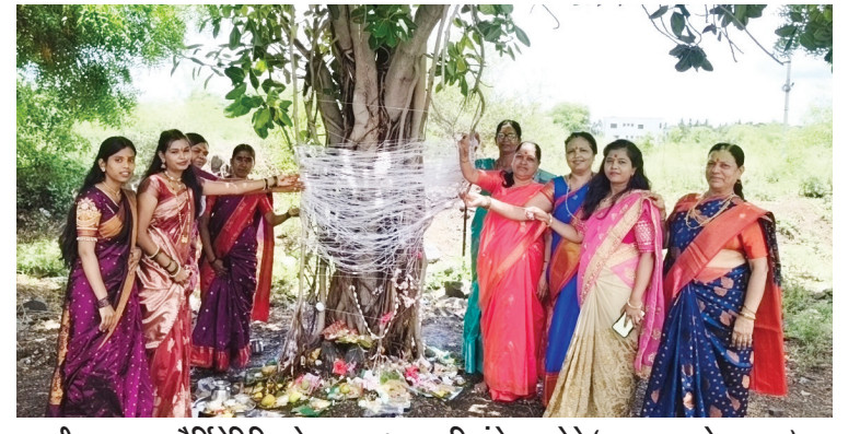
श्रीरामपूर : वटपौर्णिमेनिमित्ताने महावटवृक्षाला महिलांचे सात फेरे