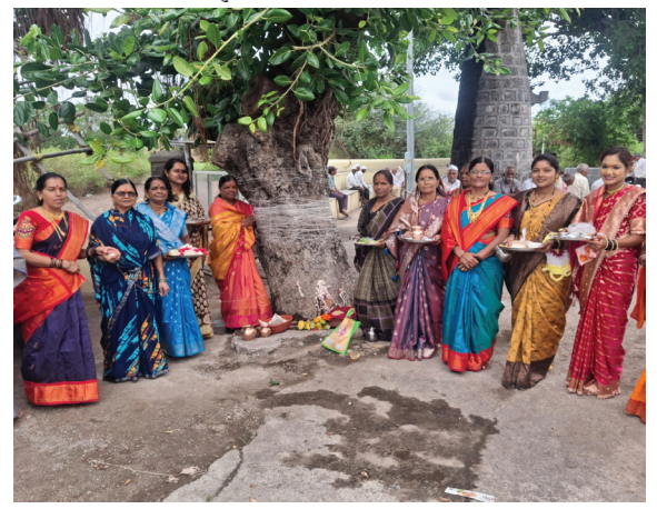
दिवे (ता. पुरंदर) येथे वटपौर्णिमेनिमित्त वटवृक्षाच्या पूजेसाठी एकत्र आलेल्या महिला.

दिवे : पुरंदर तालुक्यातील दिवे परिसरात वटपौर्णिमेचा सण महिला भगिनींनी पारंपरिक पद्धतीने आणि मोठ्या भक्तिभावाने साजरा केला. सकाळपासूनच पारंपरिक वेशभूषेत महिलांनी गावातील वटवृक्षाजवळ