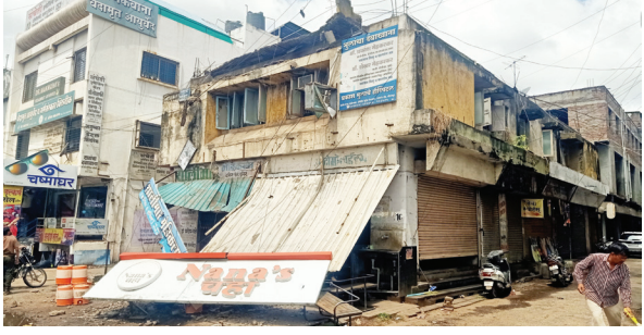
प्रतिनिधी | राष्ट्र सहाद्री

'नानाज् चहा' आणि मेडिकल दुकानावर इमारतीचा 'स्लॅब'चा कोपरा कोसळला!