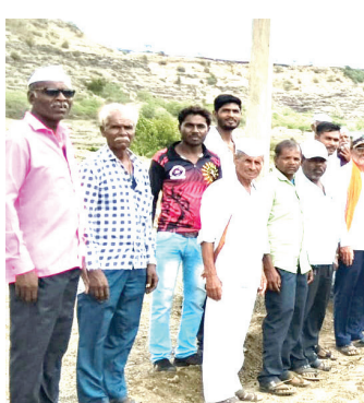
पोलीस बंदोबस्तात मंगळवारी महसूल प्रशासन आणि पोलीस यांच्या उपस्थितीत रस्ता पूर्ववत सुरु करण्यात आला समवेत ग्रामस्थ.

प्रतिनिधी | राष्ट्र सह्याद्री घारगाव : दुसऱ्याची अडवणूक करून स्वतःचा अहंकार सुखावणं एका शेतकऱ्याला चांगलंच महागात पडलं आहे. संगमनेर तालुक्याच्या पठार भागातील डोळासणे गावांतर्गत असलेल्या धुमाळवाडी परिसरातील दत्तवाडीकडे जाणारा पिढ्यान् पिढ्यांचा हक्काचा शिवरस्ता (गट नंबर २९९/२) अखेर मोकळा धास घेतोय. एका आडमुठ्या शेतकऱ्याने गेल्या दीड वर्षांपूर्वी दादागिरी करत हा रस्ता चक्र बंद केला होता. मात्र, प्राताधिकारी व तहसीलदारांच्या आदेशान्वये, पोलीस बंदोबस्तात मंगळवारी (३० जून) हा रस्ता पूर्ववत सुरु करण्यात आला असून दीड वर्षांपासून सुरु असलेला ग्रामस्थांचा 'वनवास' संपला आहे.