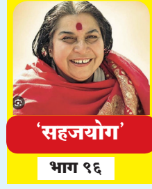
'सहजयोग' भाग १६