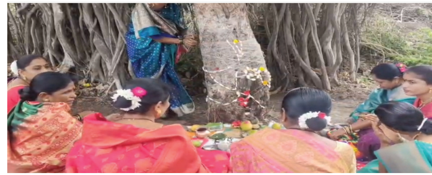
वटवृक्षाची मोनोभावी ...मोठ्या उत्साहात पूजा करताना महिला वर्ग.

सोमेश्वरनगर : बारामतीच्या पश्चिम भागात ठिकठिकाणी सोमवारी (दि. २९) वटपौर्णिमा साजरी करण्यात आली. सोमेश्वरनगर कॅम्प येथील ज्येष्ठ युवा महिला एकत्र येत वडाच्या झाडाचे पूजन केले. औषध करून, नैवेद्य दाखवून असंख्य महिलांनी वडाच्या झाडाला सूत बांधून, सात जन्मांची गाठ मजबूत ठेवण्याचे साकडे घातले. यावेळी सकाळच्या सुमारास वडाच्या झाडाजवळ महिलांची अलोट गर्दी झाली होती.