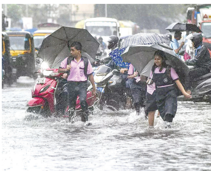
■ नवी मुंबईतील सानपाडा परिसरात रस्ते नदीसारखे दिसत होते. सायन-पनवेल हायवेवर वाहतूक कोंडी झाली. रायगडमध्ये मुंबई-गोवा महामार्गावर पाणी साचले. पालघर जिल्ह्यात शाळा-महाविद्यालयांना सुट्टी जाहीर करण्यात आली. मुंबई आणि पुण्यात झाडे कोसळण्याच्या घटनांमध्ये वाढ झाली. चेंबूरमध्ये काल एका शाळकरी मुलाचा झाड पडून मृत्यू झाला होता.

सिटी रोड, संतोषनगर आणि पश्चिम द्रुतगती महामार्गावरील जोगेश्वरी भागात २-३ फूट पाणी साचल्याने वाहनांची मोठी कोंडी निर्माण झाली. वरळी आणि चेंबूरमधील अनेक सखल भागांत पाणी घुसले. संध्याकाळी घरी परतणाऱ्या लाखो मुंबईकरांना पूर्वी द्रुतगती महामार्गावर घाटकोपर ते ठाणे दरम्यान प्रचंड वाहतूक कोंडीचा सामना करावा लागला. वसई-विरारमध्ये वायवळ पाड्यात ३ दुचाकी आणि २ कार वाहून गेल्या. सुदैवाने एका कार चालकाने उडी मारून आपला जीव वाचवला. नालासोपारा, कल्याण आणि ठाण्यातील अनेक भागांत पूरस्थिती निर्माण झाली. ठाणे महापालिका क्षेत्रात ८ तासांत ८२.७६ मिमी पावसाची नोंद झाली.हवामान विभागाने विदर्भ आणि मराठवाड्यासाठी ऑरेंज अलर्ट जारी केला आहे. चंद्रपूर, गडचिरोली, अमरावती, अकोला आणि बुलडाणा जिल्ह्यांत अतिमुसळधार पावसाची शक्यता आहे. प्रशासनाने नागरिकांना सतर्क राहण्याचे आवाहन केले आहे.