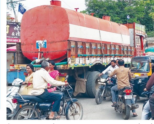
चिंतातुर झाला आहे. मागील आठवड्यात महाराष्ट्र राज्यासह अहिल्यानगर जिल्हातील काही

कर्जत : जून संपला. जुलै उजाडला तरी कर्जत तालुक्यात अपवाद एक-दोन मंडळ क्षेत्र सोडता अद्याप दमदार पाऊस झाला नाही. खरीप हंगामाची पेरणीचे प्रमाण अल्प असून कर्जत तालुक्यातील बहुतांश गावात भर पावसाळ्यात रस्त्यावर पाण्याचे टँकर वाहताना दिसत आहे. आजमितीस कर्जत तालुक्यातील या १६ गावांसाठी १६ टँकर सुरू आहेत. तर खरीप पेरणीचे प्रमाण फक्त १३ ते १५ टक्के असल्याची माहिती कृषी विभागाकडे नोंद आहे. यामुळे कर्जतकर जनतेचे डोळे वरुणराजाच्या दमदार