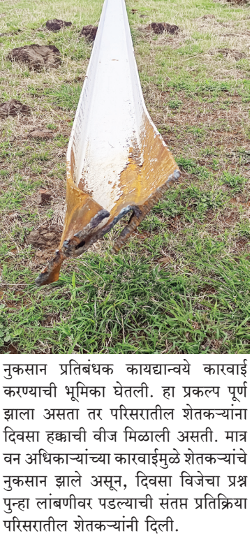
नुकसान प्रतिबंधक कायद्यान्वये कारवाई करण्याची भूमिका घेतली. हा प्रकल्प पूर्ण झाला असता तर परिसरातील शेतकऱ्यांना दिवसा हक्काची वीज मिळाली असती. मात्र वन अधिकाऱ्यांच्या कारवाईमुळे शेतकऱ्यांचे नुकसान झाले असून, दिवसा विजेचा प्रश्न पुन्हा लांबणीवर पडल्याची संतप्त प्रतिक्रिया परिसरातील शेतकऱ्यांनी दिली.