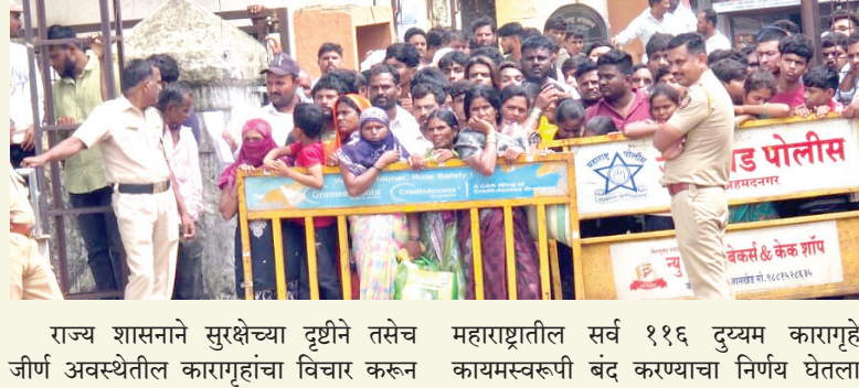
राज्य शासनाने सुरक्षेच्या दृष्टीने तसेच महाराष्ट्रातील सर्व ११६ दुय्यम कारागृहे जीर्ण अवस्थेतील कारागृहांचा विचार करून कायमस्वरूपी बंद करण्याचा निर्णय घेतला

आहे. अनेक ठिकाणी कारागृहांची इमारत जीर्ण झाल्याने तसेच कैदी पळून जाण्याच्या घटनांमध्ये वाढ झाल्यामुळे हा निर्णय घेण्यात आला आहे. त्यानुसार या कारागृहांतील सर्व कैद्यांना जवळच्या जिल्हा किंवा मध्यवर्ती कारागृहात टप्प्याटप्प्याने स्थलांतरित करण्याची प्रक्रिया सुरू आहे. याच निर्णयाची अंमलबजावणी करत जामखेड येथील दुय्यम कारागृहातील एकूण ६२ आरोपींना ९ जुलै रोजी दुपारी सुमारे २ वाजण्याच्या सुमारास पोलीस वाहनांच्या